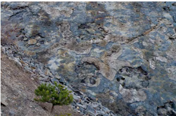
FIGURA 5. Vista parcial de una de las paredes de Valdesamario, en la que se observan varias marcas de raíces de gran tamaño, correspondientes a licopodios.

Un LIG similar, pero localizado en León, es el de los Yacimientos carboníferos de Valdesamario e Igüeña (Fig. 1, 4). Está formado por dos afloramientos próximos que conservan paredes con abundantes marcas de raíces (Fig. 5), así como moldes de raíces y troncos en ocasiones de gran longitud y tamaño. Al contrario que en el caso de Palencia, en estos yacimientos no se ha puesto en marcha ninguna medida de conservación o gestión. En Valdesamario, a la fragilidad natural ocasionada por la inestabilidad y meteorización de la pared se le une una alta vulnerabilidad debida a la gran facilidad de acceso. Ambos factores han determinado el altísimo deterioro experimentado por el contenido fósil de estas capas en los últimos diez años. Por el contrario, el yacimiento de Igüeña está localizado en una pista minera, muy lejos de zonas concurridas por lo que, aunque es un elemento de cierta fragilidad, su vulnerabilidad es menor y su deterioro acontece a un ritmo más lento.