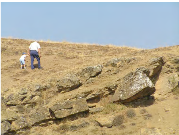
FIGURA 3. Abuelo y nieto pasean por el histórico yacimiento de Colle (León) mientras buscan y recolectan fósiles, muchos de los cuales aparecen sueltos en las capas margosas de este afloramiento.

En este grupo destacan algunos yacimientos históricos como el de Colle (Fig. 1, 15; Fig. 3), de donde proceden los “fósiles de Sabero” publicados originalmente en trabajos de la segunda mitad del siglo XIX. Otro yacimiento relevante es el de trilobites cámbricos de Los Barrios de Luna (Fig. 1, 3), estudiado intensamente desde los años 50 del pasado siglo. Algunos otros son estratotipos de formaciones, como el Yacimiento arrecifal de la Fm. Santa Lucía en el Arroyo de El Puerto (Fig. 1, 8) que ha sido considerado como de interés principal paleontológico por la riqueza, diversidad y magnífica preservación de sus fósiles.