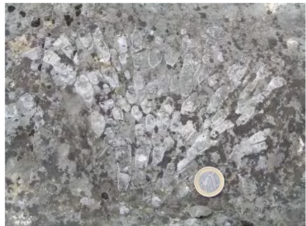
FIGURA 4. Colonia de corales rugosos disphyllidos procedente de la Cantera de Lebanza (Palencia). Esta colonia ha sido extraída de su matriz y, por tanto, no se encuentra ya en el yacimiento.

vulnerables. A modo de ejemplo, se expone el caso del Yacimiento arrecifal de la Fm. Portilla en Matallana de Torio (Fig. 1, 10), donde un cartel situado en una ruta a pie de afloramiento alerta a los visitantes de la presencia de fósiles en la zona. Esta actuación ha conllevado una importante disminución del número, diversidad y calidad de fósiles ligados a este yacimiento, que es frecuentemente visitado por excursiones organizadas por diversas empresas de turismo en la naturaleza y por asociaciones locales. Otros yacimientos, como los ya citados de Colle y Los Barrios de Luna son visitados cada año por numerosos estudiantes y su grado de deterioro ha sido, a pesar del carácter extensivo de estos yacimientos, desmesurado.