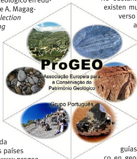
Fig. 5. Logo de Grupo de trabajo portugués, perteneciente a la Asociación Europea para la Conservación del Patrimonio Geológico (ProGEO).

Fig. 4. Captura de pantalla de la web de Natural England, una entidad pública dedicada a conservar el medio ambiente. Una de las bases del trabajo realizado en Natural England se centra en la concienciación de la población, como se aprecia en este Countryside Code, un código de conducta destinado a respetar, proteger y disfrutar del mundo rural.