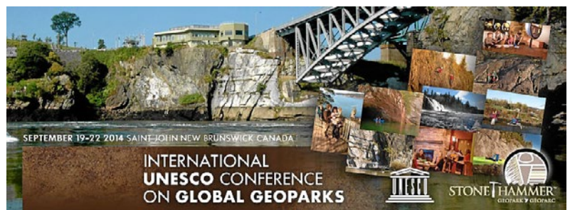
Fig. 6. Los Geoparques son figuras auspiciadas por la Organización de las Naciones Unidas para la Educación, la Ciencia y la Cultura (UNESCO) aunque, por ahora, no tienen la categoría oficial de la que disfrutaban otros programas propios de este organismo, como el denominado Patrimonio de la Humanidad.

Fig. 5. Logo de Grupo de trabajo portugués, perteneciente a la Asociación Europea para la Conservación del Patrimonio Geológico (ProGEO).