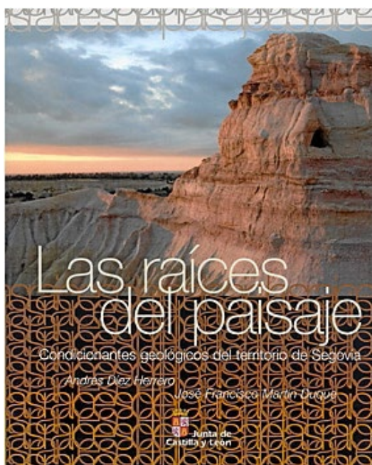
Fig. 7. Portada del libro Las raíces del paisaje , un manual de lectura imprescindible para reconocer las raíces geológicas de muchos de nuestros paisajes.